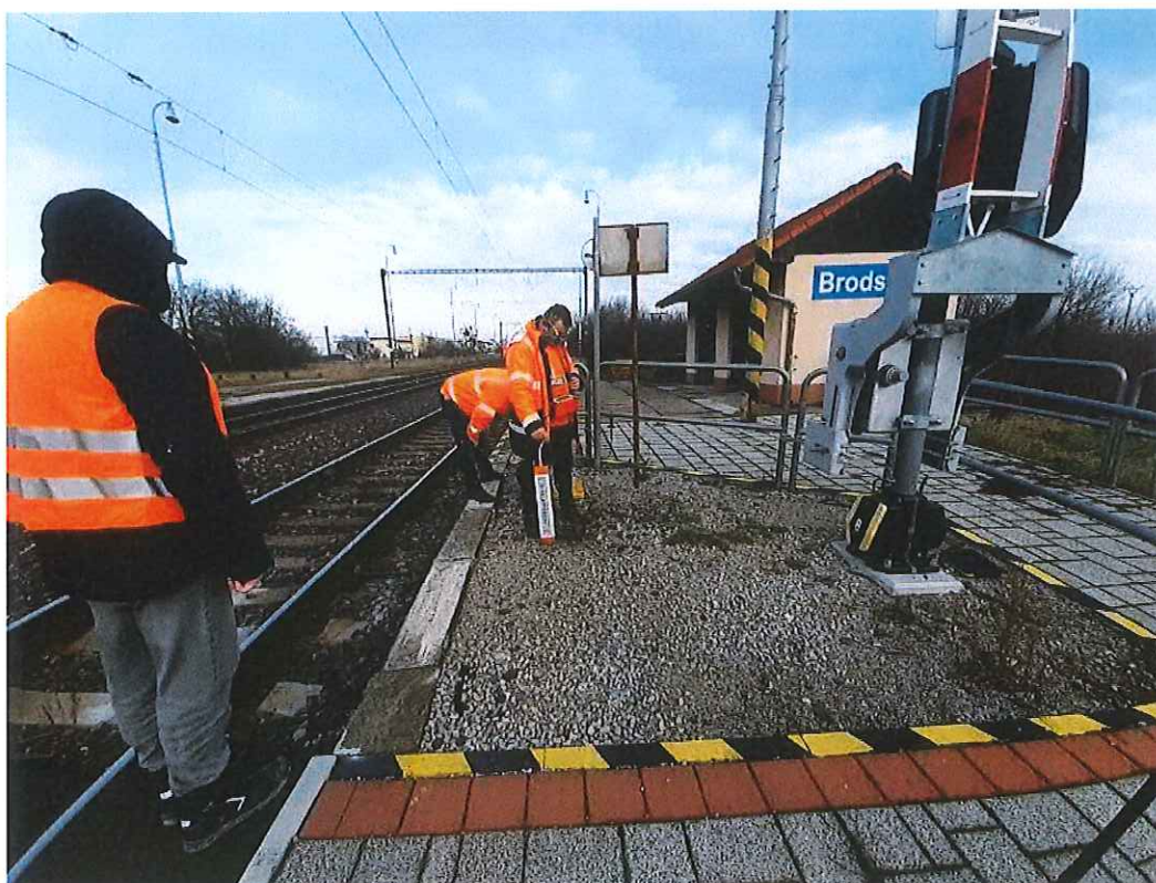
Proces vytyčovania inžinierskych sietí - 5. 2. 2021 ŽSR, OR TT, sekcia OZT - stanica Brodské strana 6 z 14