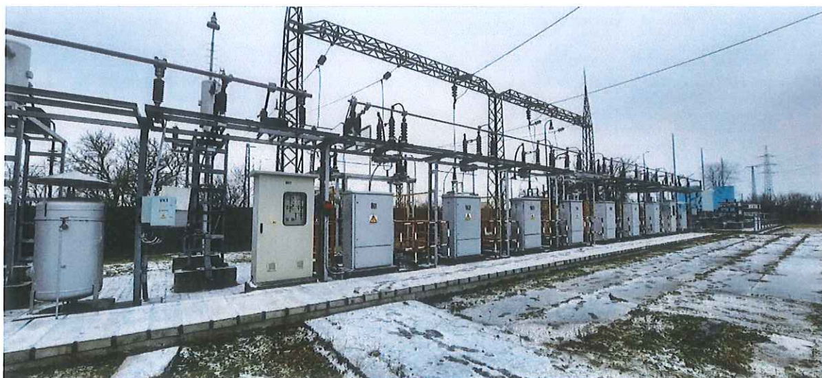
Miestne šetrenie jestvujúci areál TNS Zohor – 17.2.2021