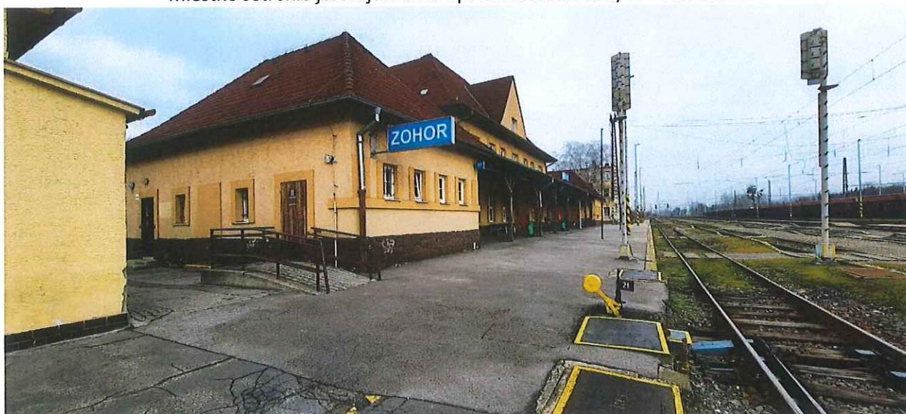
Miestne šetrenie ŽST Zohor – 19.2.2021