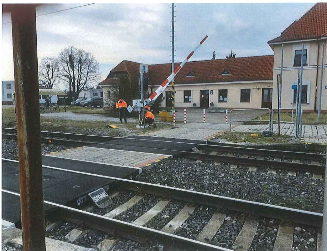
Proces vytyčovania inžinierskych sietí - 5. 2. 2021 ŽSR, OR TT, sekcia OZT - stanica Brodské