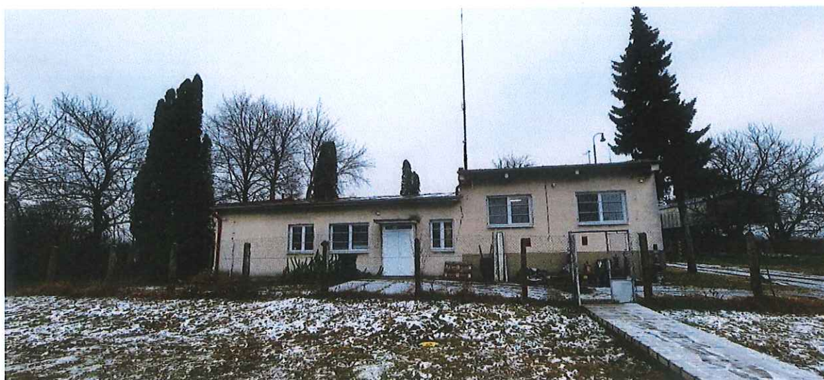
Miestne šetrenie jestvujúci areál TNS Zohor – 17.2.2021