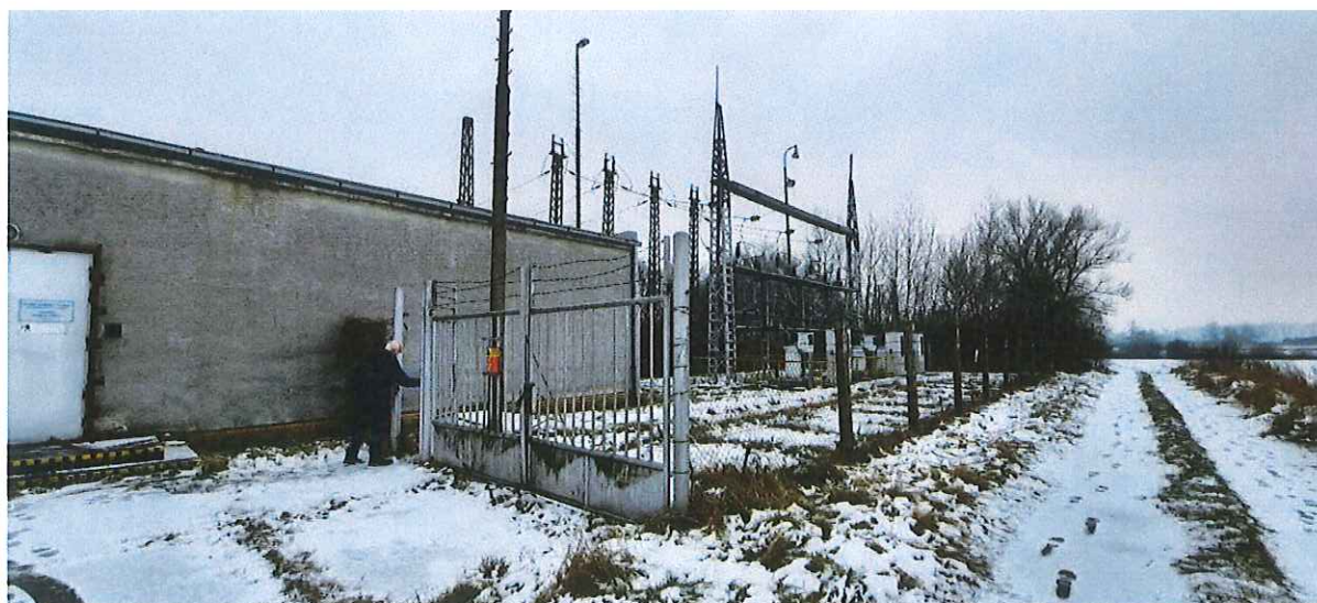
Miestne šetrenie jestvujúci areál Spínacia stanica Kúty I. – 17.2.2021