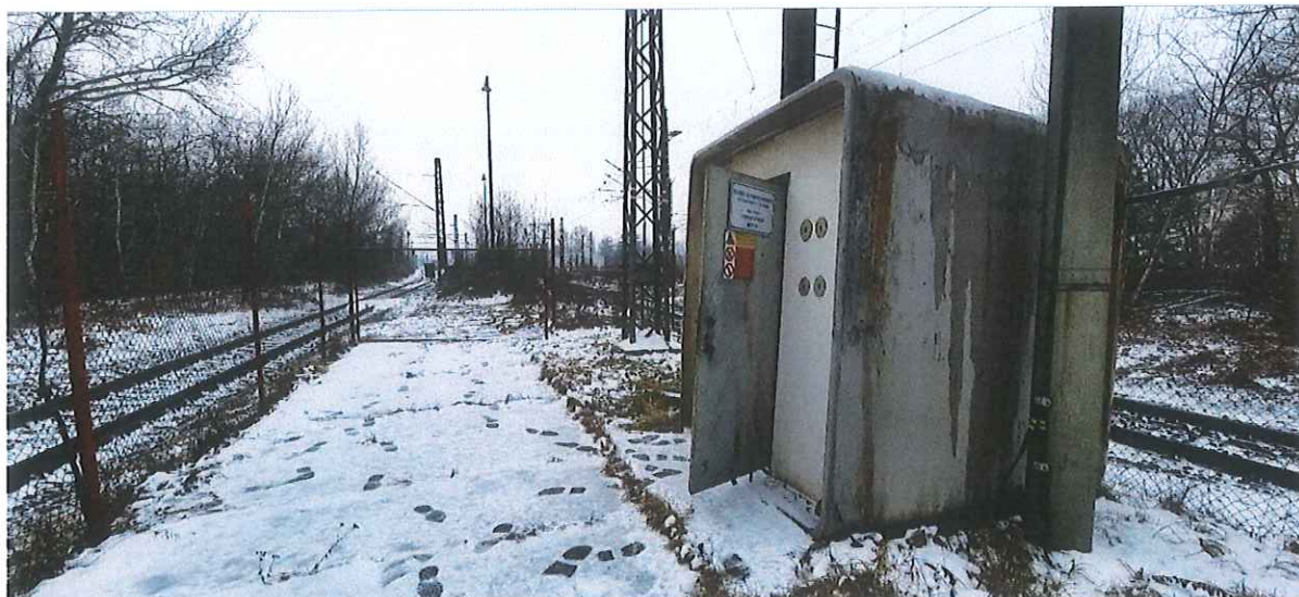
Miestne šetrenie jestvujúci areál Spínacia stanica Kúty II. – 17.2.2021