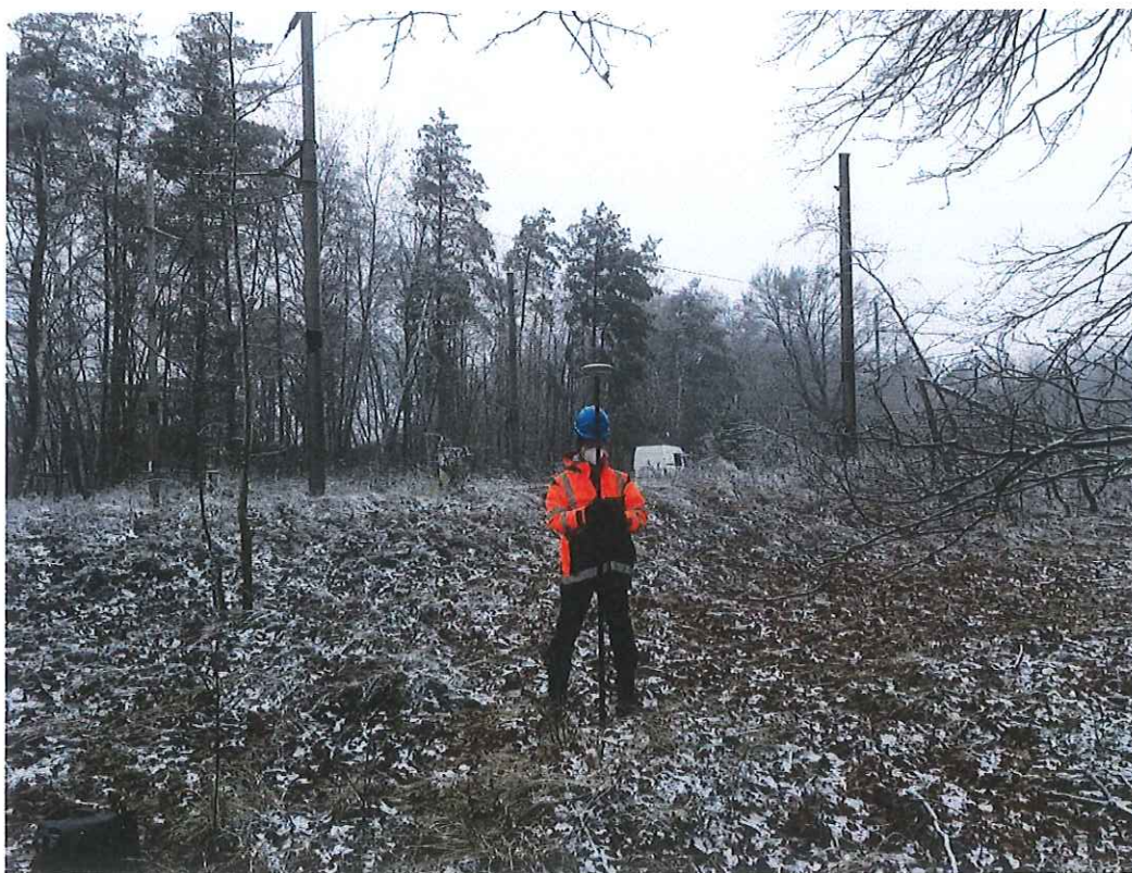
Proces vytyčovania inžinierskych sietí - 10. 2. 2021 ŽSR, OR TT, sekcia OZT – Kúty (mimo) – št. hr. SR/ČR