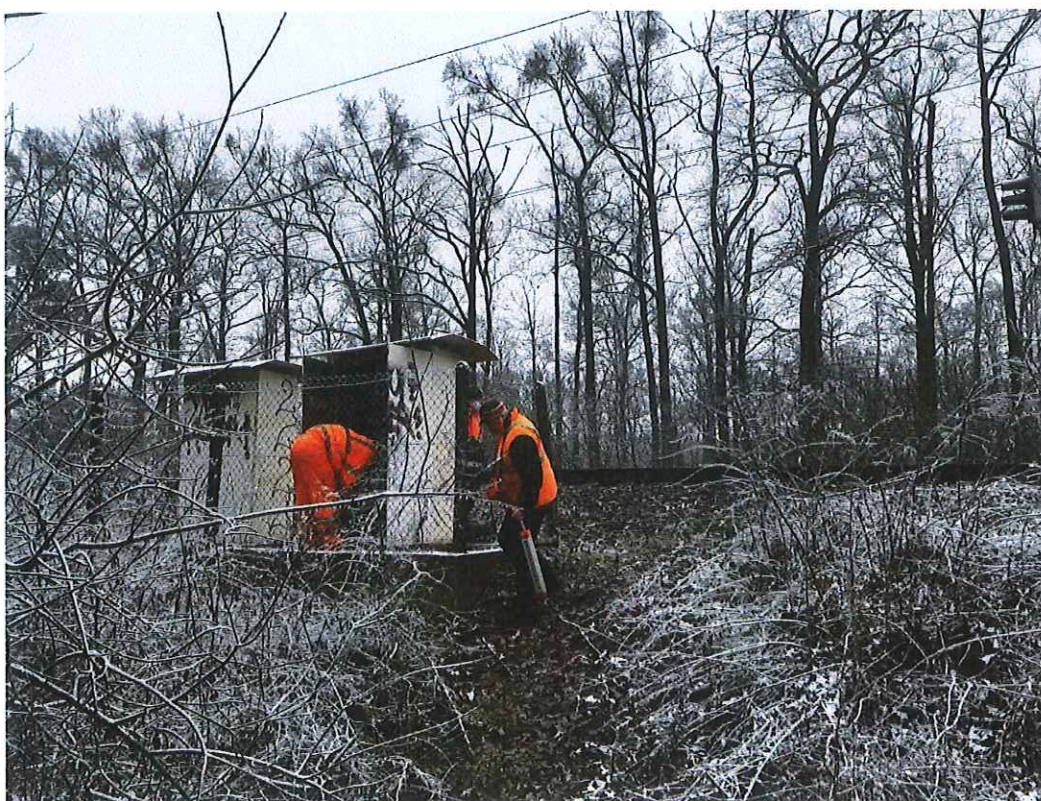
Proces vytyčovania inžinierskych sietí - 10. 2. 2021 ŽSR, OR TT, sekcia OZT – Kúty (mimo) – št. hr. SR/ČR