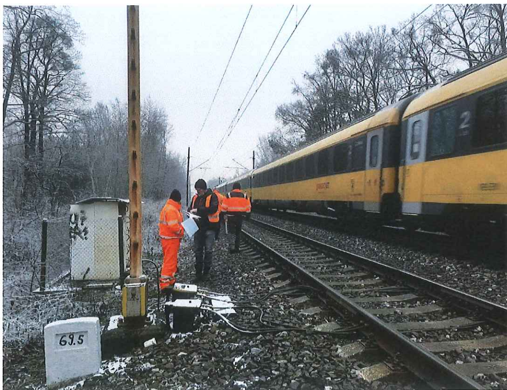
Proces vytyčovania inžinierskych sietí - 10. 2. 2021 ŽSR, OR TT, sekcia OZT – Kúty (mimo) – št. hr. SR/ČR