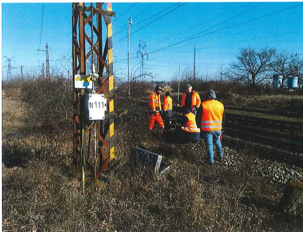
Proces vytyčovania inžinierskych sietí – NN káblov – EOv, napájania v stanici Zohor, zhlavie Malacky