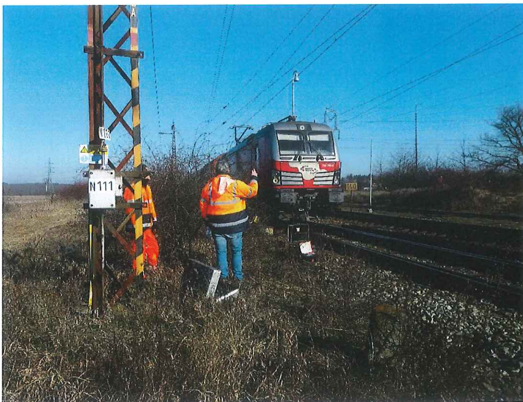
Proces vytyčovania inžinierskych sietí – NN káblov – EOv, napájania v stanici Zohor, zhlavie Malacky